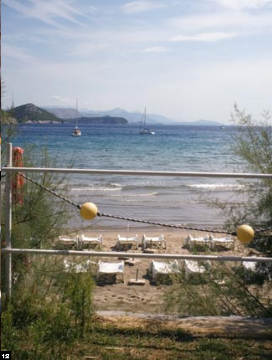
11 Buza 12 Het strand van Lopud