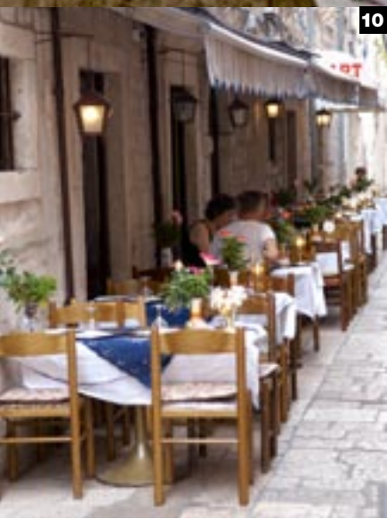
07 Levnat 08 Café Royal 09 Veel hotels aan de kust op het schiereiland Lapad hebben een heerlijk zwembad pal aan zee 10 Een straatje in het oude centrum van Dubrovnik